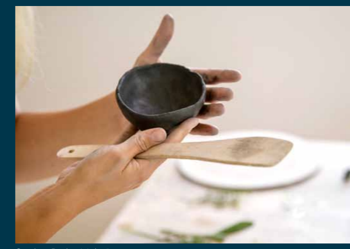
Studija „Broliai Moliai“