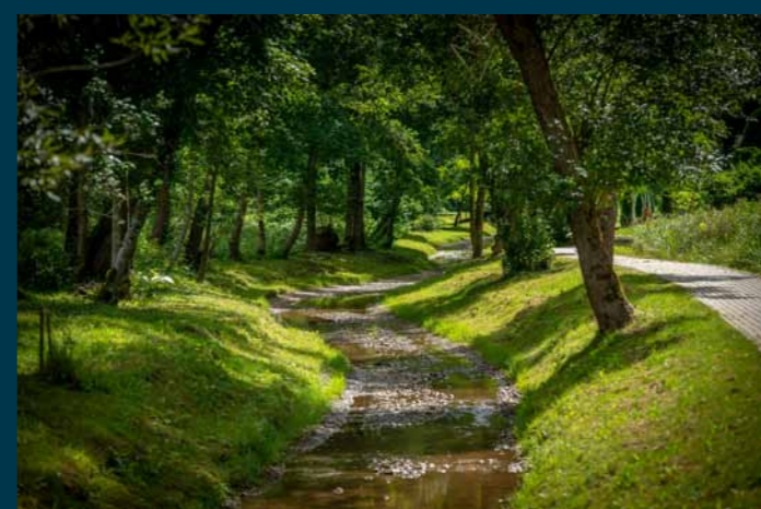
Vaiguos upė-gatvė Plokščiuose