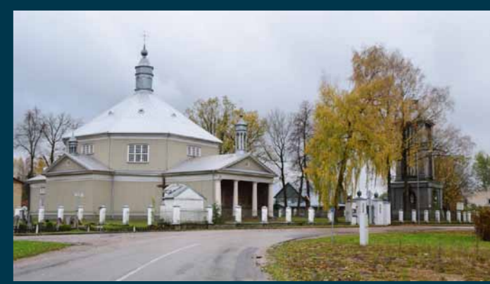
Griskabūdžio Kristaus Atsimainymo bažnyčia