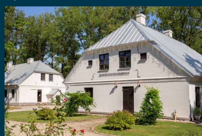
Zypių dvaras. Restoranas „Kuchmistras“