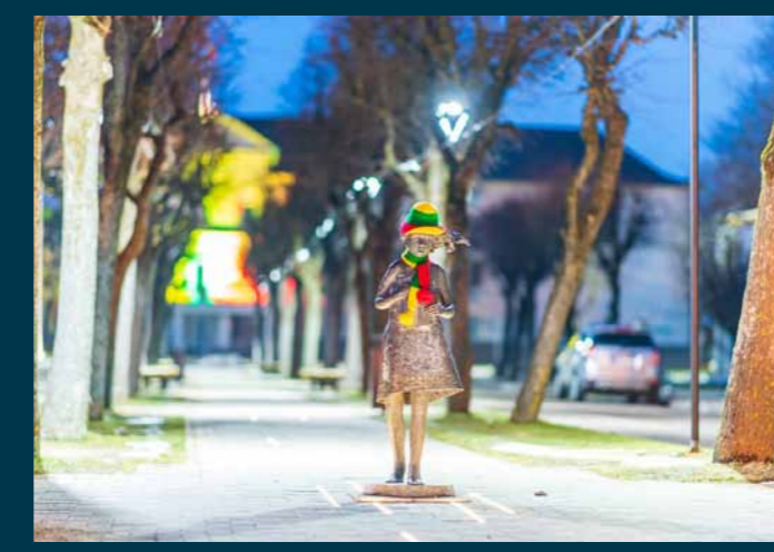
Paminklas „Simboliai laike“