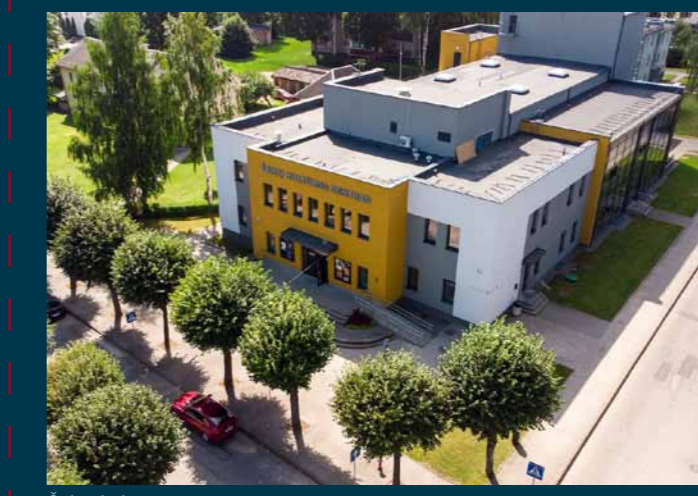
Šakių kultūros centras