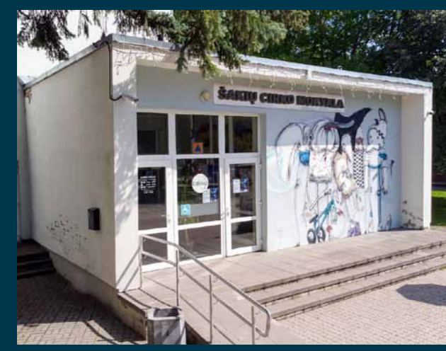
Šakių cirko mokykla