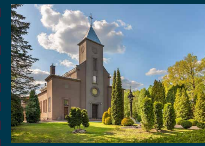
Šakių Šv. Jono Krikštytojo bažnyčia