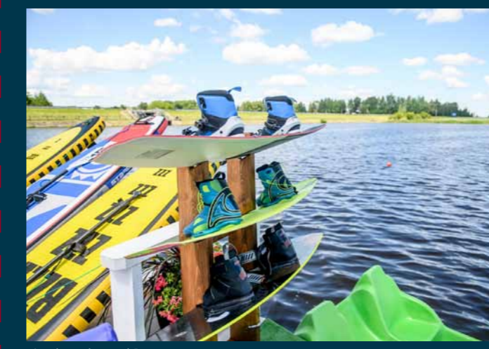
„Apolo wake park“