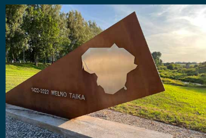
Paminklas Melno taikai Kudirkos Naumiestyje

Topografinis pagrindas: M:1:50 000 skaitmeninis rastinis žemėlapis LTDBK 50 000 - SR © Nacionalinė žemės tarnyba prie Žemės ūkio ministerijos, 2023 Vairo M 1:125 000