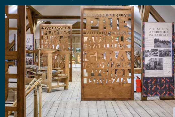
Zypių dvaras. Zanavykų muziejus