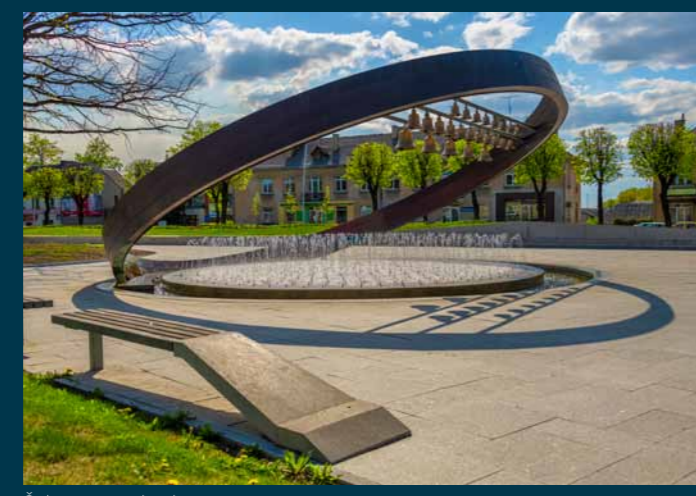
Šakių miesto karlionas