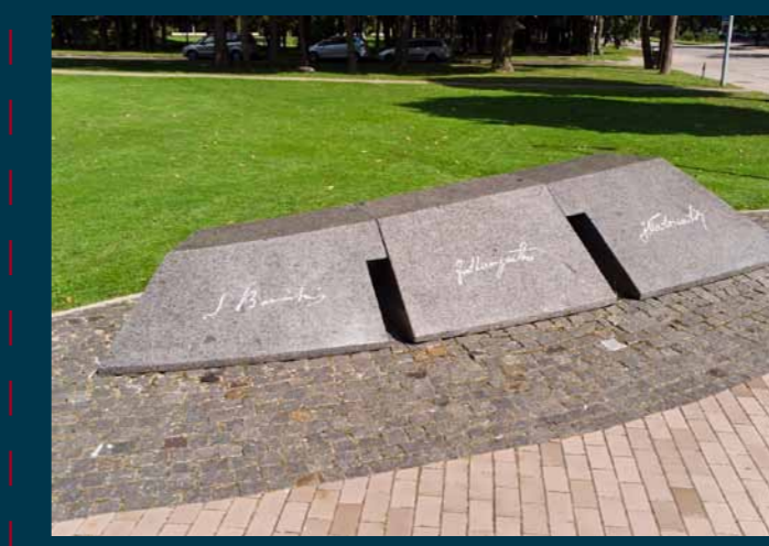
Paminklas Lietuvos Nepriklausomybės akto signatarams