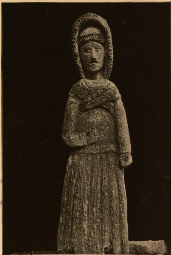
Senovinio lietuvių kryžiaus ornamentas.